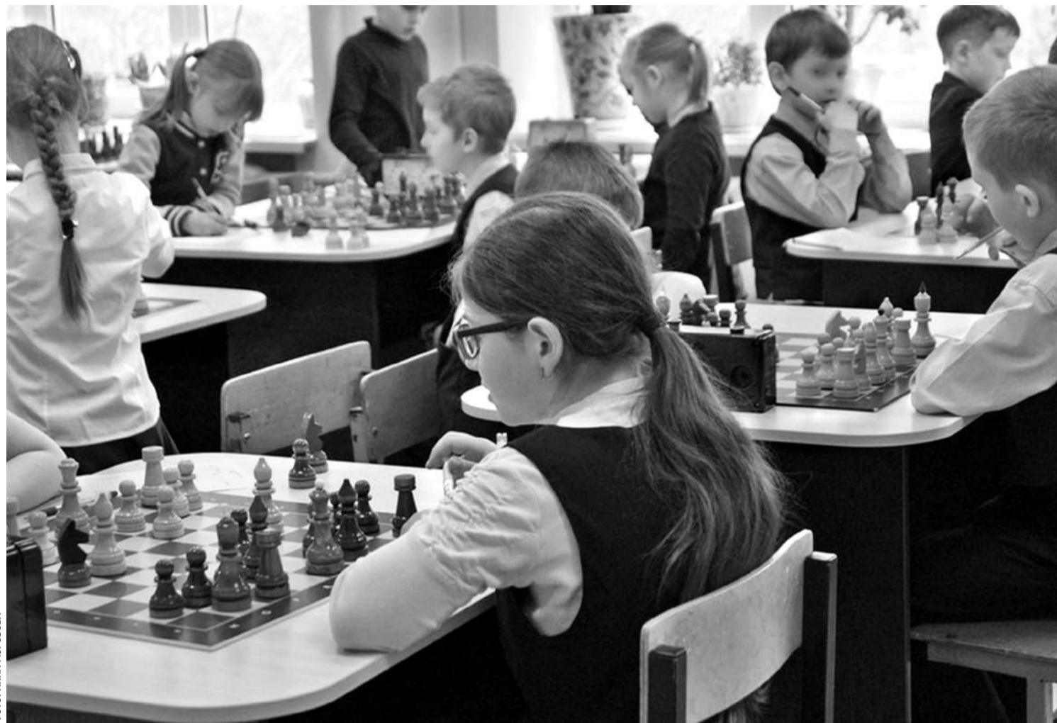
В образовательном комплексе «Луч»

— Высокий уровень локального нормотворчества. В этих учебных заведениях есть хорошо проработанные локальные нормативные акты, которые обрабатывают порядок. Основные образовательные программы и программы развития направлены на активное познание мира, развитие учебно-исследова-